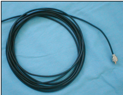
Exemplo de choque balun

A G5RV necessita de balun para funcionar corretamente. O balun ajuda a prevenir RFI e TVI. Um balun simples pode ser feito com o próprio coaxial de alimentação da antena. Enrole 10 ou 15 espiras, com diâmetro de 20cm. Amarre as espiras com um fio não condutor (nylon, fita isolante, etc.)